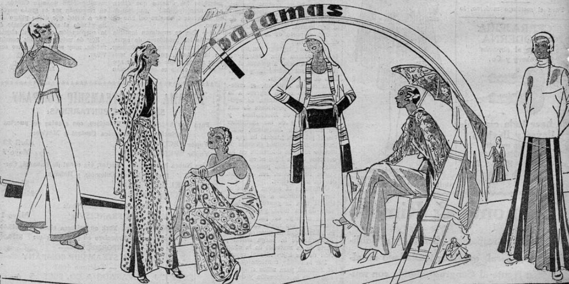
Los más variados modelos de palmas son presentados en Palm Beach. Aquí vemos algunos de los más interesantes