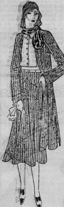
Modelo de crepé azul claro, con cuello de piel. La forma del abrigo es original y atrayente

Por lo demás, conviene que sea el Tribunal para niños el que resuelva de la colocación y destino de los hijos de padres pobres divorciados.