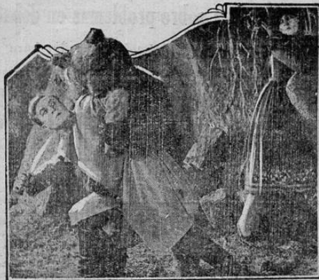
Scene from "MICHAEL STROGOFF" UNIVERSAL FILMS DE FRANCE

Las funciones de hoy, viernes, en el gran Teatro Raventos presentan una formidable atracción. En la función de las tres de la tarde y a las siete de la noche, se pasa el último triunfo del formidable William Powell, cuya magnífica interpretación hace de esta película "El Acusador de Sí Mismo", una de las últimas joyas de la Paramount. Todo nuestro público conoce de sobra la actuación brillantísima de este formidable actor, dada ya a conocer nuestro primer coliseo, gran Teatro Raventos, por obras como "La Redada", "Intromisión", "Caras Olvidadas", "Beau Geste", "La Calle del Azar" y "La Sombra de la Ley". William Powell con "El Acusador de Sí Mismo" que se pasa hoy viernes a las tres y a las siete, agrega un triunfo más al largo estabón de ellos que tiene conquistado. En la función de las ocho y media se re-estrena la novela cumbre de Julio Verne "Miguel Strogoff", de una intensidad dramá-