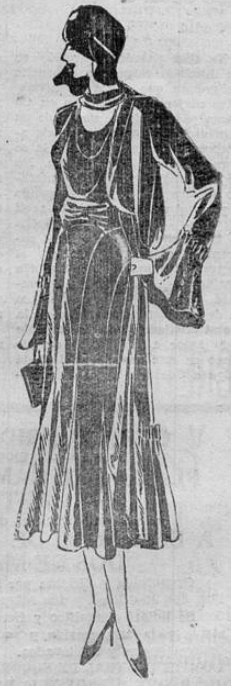
Traje de noche, de punto de malla, enteramente cubierto de adornos de azabache